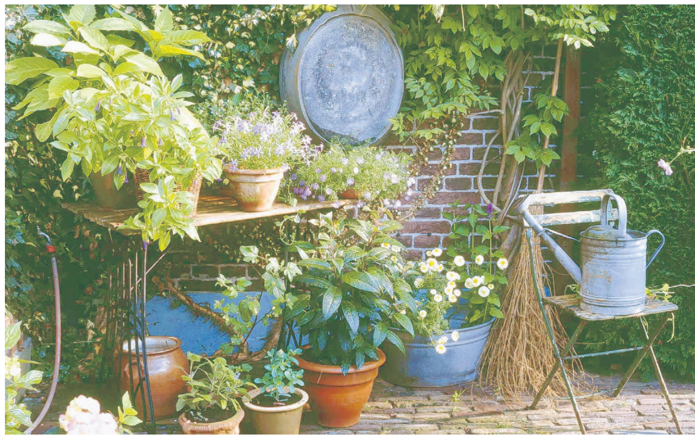
Schön schattig! Neben Immergrünen wie Efeu oder Kirschlorbeer bezaubert im hellen Schatten auch die einjährige violettblühende Laurentie (Isotoma).

Zwei Teile Rasenschnitt mit einem Teil holzigem Schreddermaterial mischen, um die Masse lockerer und luftdurchlässiger zu machen. Geeignet zum Untermischen ist auch Rindenmulch, trockenes Laub oder Hobelspäne von unbehandeltem Holz. Vorteilhaft ist es, wenn Sie den Rasenschnitt einige Tage welken lassen, bevor Sie ihn in den Komposter füllen. Impfen der Mischung mit Kompost-Beschleuniger. Einfüllen der Mischung in den Thermo-Komposter. Nach zwei bis drei Wochen erneut vermischen.